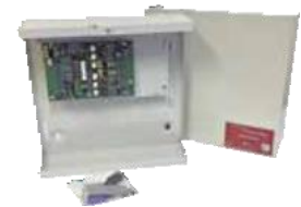
CONC-995080 LAN izoliatorius korpusė