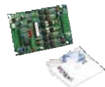
995080EXP LAN izoliatorius plokštė